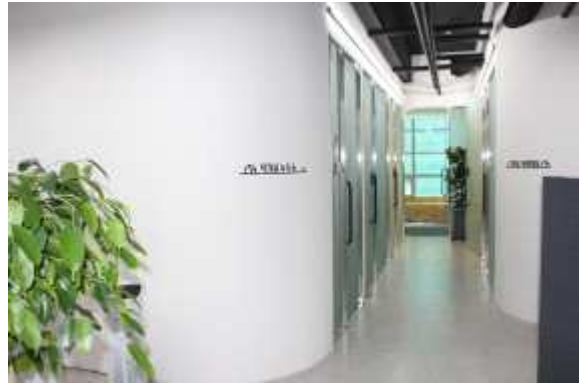
집필실 입구 및 복도